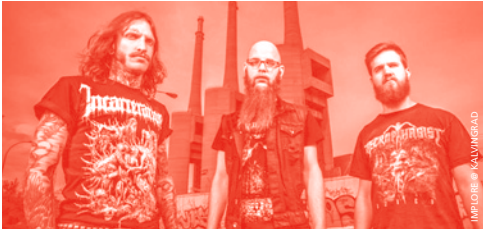
IMPLORER © ACXDC

♦ KALVINGRAD & MUMAGRINDER INC | 20H | 12CHF ACxDC | power violence | USA IMPLORE | grindcore | DE WRENSH | hardcore | FR