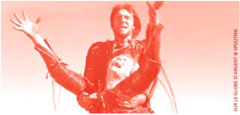
SUR LE GLOBE D'ARGENT

♦ SPOUTNIK | 14H | FILM À 15H BRUNCH VEGAN | PRIX LIBRE, FILM | TARIF NORMAL SUR LE GLOBE D'ARGENT | ANDRZEJ ZULAWSKI POLOGNE, 1976, 157min, COUL., BLU-RAY, VOSTFR