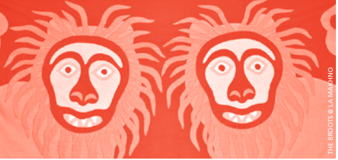
THE BROOTS © LA MAKHNO

♦ LA MAKHNO | 19H | PRIX LIBRE •SOUTIEN À YOUTH FOR SETTLEMENT• THE BROOTS | strange Reggae/Dirty Beat Récolte d'appareil photo, ramène ton vieil appareil! Vente de Keffieh en soutien