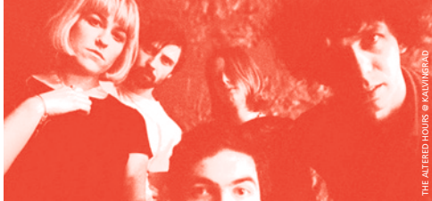
THE ALTERED HOURS © KALVINGRAD

♦ KALVINGRAD | 20H | 12CHF DON'T | punk | USA THE ALTERED HOURS | post punk | IRL