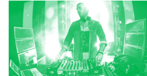
POPOF © LE ZOO

♦ LE ZOO | 00H | 15CHF, 18CHF AP 1H A TASTE OF RAVE [TECHNO MINIMAL / ELECTRO] POPOF | Cocoon | FR FABIAN KOZELSKY | M'Animals | GE