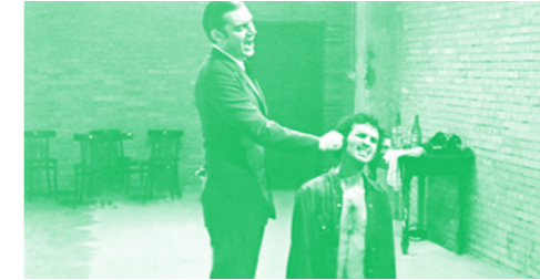
ENQUÊTE SUR UN CITOYEN AU-DESSUS DE TOUT SOUPÇON © SPOUTNIK

♦ SPOUTNIK | 20H30 | TARIFS SPOUTNIK // LES ANNÉES DE PLOMB // ENQUÊTE SUR UN CITOYEN AU-DESSUS DE TOUT SOUPÇON (Indagine su un cittadino al di sopra di ogni sospetto) Elio Petri - 1970 - Italie - 112 min - fiction