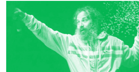
ASHER SELECTOR © LA MAKHNO

♦ LA MAKHNO | 20H | ENTRÉE LIBRE VYBZ ORGANIZER + ASHER SELECTOR and friends