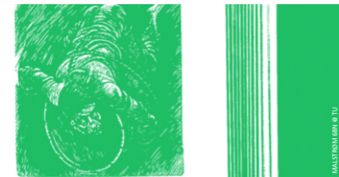
MALSTRØM 68N

♦ URGENCE DISK | 17H-21H | ENTRÉE LIBRE CARTE BLANCHE A KARPE DIEM ♦ TU - THÉÂTRE DE L'USINE | 19H | 20CHF | 15CHF MALSTRØM 68N, partie 2 | Aurélien Gamboni & Sandrine Teixido en collaboration avec Théo Keiflin