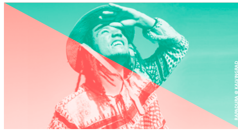
RAPADURA © KALVINGRAD

♦ KALVINGRAD | 21H | 12CHF RAPADURA | hip-hop | BR KEMAR | hip-hop dj set | CH