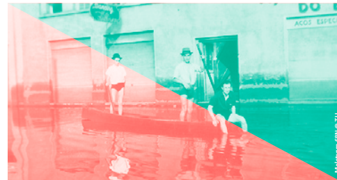
MALSTRØM 68N

♦ TU | 18H | 20 CHF / 15 CHF MALSTRØM 68N, partie 1 | Aurélien Gamboni et Sandrine Teixeira en collaboration avec Théo Keiflin