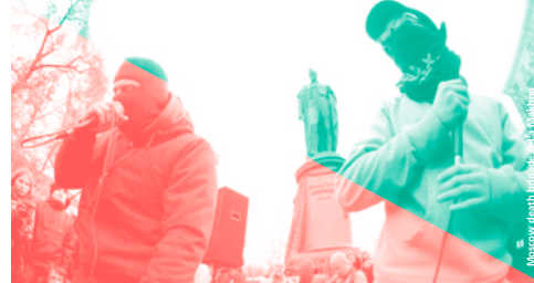
MOSCOW DEATH BRIGADE © FORDE

♦ LA MAKHNO | 19H-3H | ENTRÉE LIBRE WHAT WE FEEL | HxC antifa | RU MOSCOW DEATH BRIGADE | Rap HxC antifa | RU